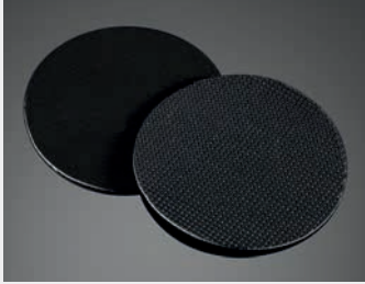
Das Folienmaterial PF800 ist ein vielseitiges Poromer mit vielen Anwendungsmöglichkeiten.