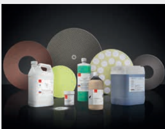
Pureon bietet eine breite Palette an massgeschneiderten Lösungen. Nehmen Sie mit uns Kontakt auf.