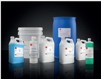
Pureon bietet eine Vielzahl von Suspensionen mit unterschiedlichen Viskositäten und massgeschneiderten Formulierungen für SUBA™-Pads. Wir unterstützen Sie gerne bei der Suche nach den am besten geeigneten Produkten.