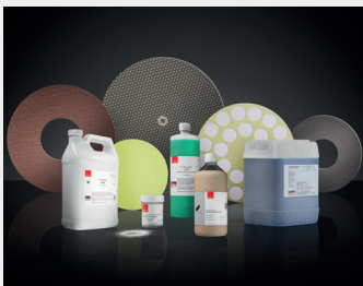
Pureon bietet eine breite Palette an massgeschneiderten Lösungen. Nehmen Sie mit uns Kontakt auf.